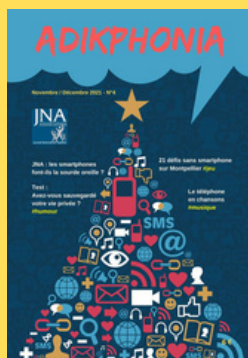
N°4- Novembre / Décembre 2021