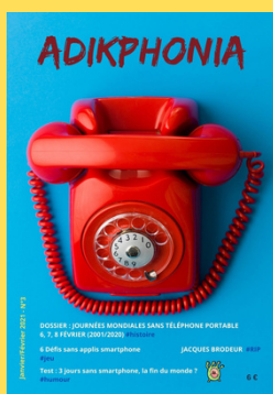
N°3 - Janvier/Février 2021