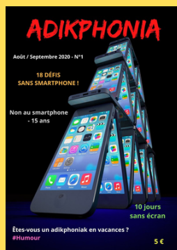
N°1 Août/Septembre 2020

Adikphonia est uniquement en version papier. Vous pouvez décider le début de votre abonnement à partir du N°1, N°2, N°3